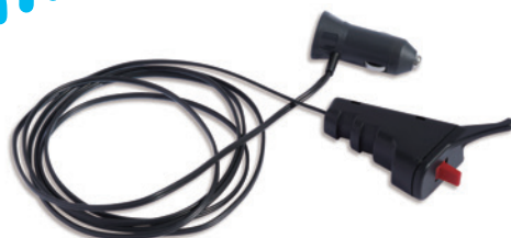
全旋回グラスパーVSD リモコン送信機セット

GV-62SD GV-122SD GV-202SD ※写真はGV-122SDです。