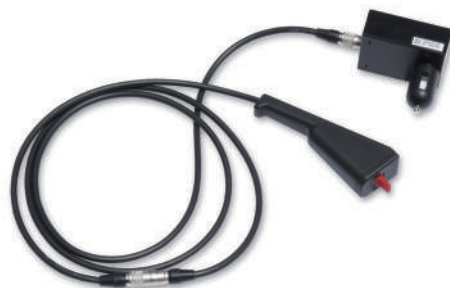
全巡回グラスパー ダイナ リモコン送信機セット