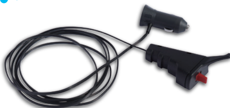
全旋回グラスパーVSD リモコン送信機セット